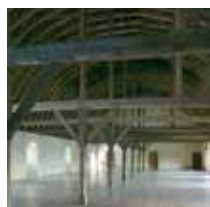
DORTOIR DES CONVERS