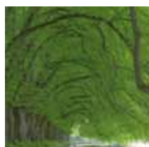
ALLÉE DE TILLEULS